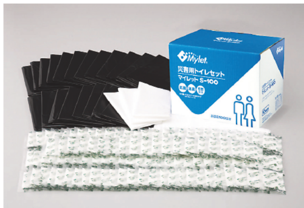
●簡易トイレ マイレット